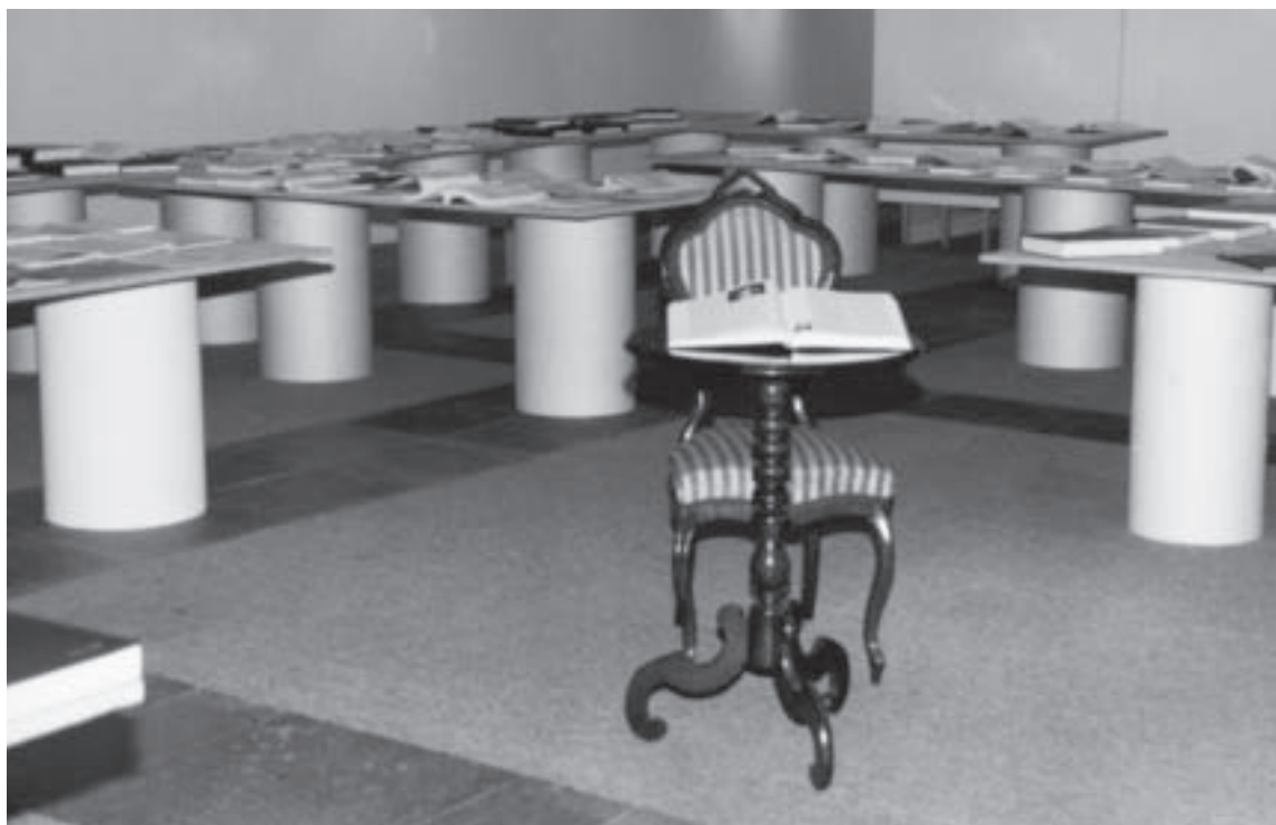
Razstava publikacij in predstavitev znanstvenoraziskovalnega dela na FF ob praznovanju 15. obletnice ZIFF (maj 1994), foto: Igor Lapanje

programu za leto 1992 so se pridružili še štirje raziskovalno-razvojni projekti s področja psihologije, pedagogike in sociologije. Skupno število raziskovalcev je 414, od tega 206 raziskovalcev, zaposlenih na FF, 128 pa je zunanjih sodelavcev. Odobrenih sredstev pa v obsegu 32,34 FTE. Akcija mladih raziskovalcev se je nadaljevala kot ena prednostnih nalog, število se je med letom spreminjalo in doseglo 92. Posebnih pogodb je bilo samo pet novih, za psihološka in pedagoška raziskovanja. Sodelovali smo pri dogovorih za izpeljavo in sofinanciranje prireditev Slovenske izseljenske matice ob praznovanju 500. obletnice odkritja Amerike. Tudi letos smo organizirali vsakoletno predstavitev raziskovalnega dela na filozofski fakulteti za leto 1991, ki jo je spremljalo nekaj prireditev. Organizirali smo pet tiskovnih konferenc ob izdaji sedmih publikacij v zbirki Razprave FF. Za promocijo naših publikacij smo organizirali in izpeljali prodajo publikacij po Sloveniji (knjigarne in knjižnice). Tako smo si odprli trg: prodaja poteka na ZIFF po naročilnici. Komisija za tisk je uspešno izpeljala zastavljeni program. Poslovanje inštituta je potekalo po utečenih smereh: na organizacijskem, svetovalnem in finančnem delu. Z letom 1992 se je končalo petletno obdobje usmerjenih raziskovalnih programov (URP).