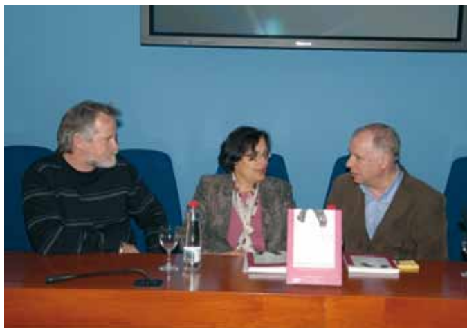
► Prostitucija je problem družbe ...