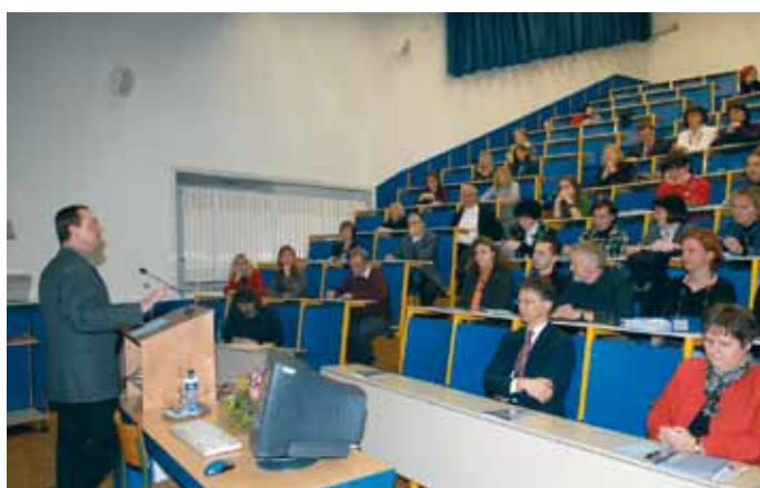
► Dušo bomo najprej obremenili ...