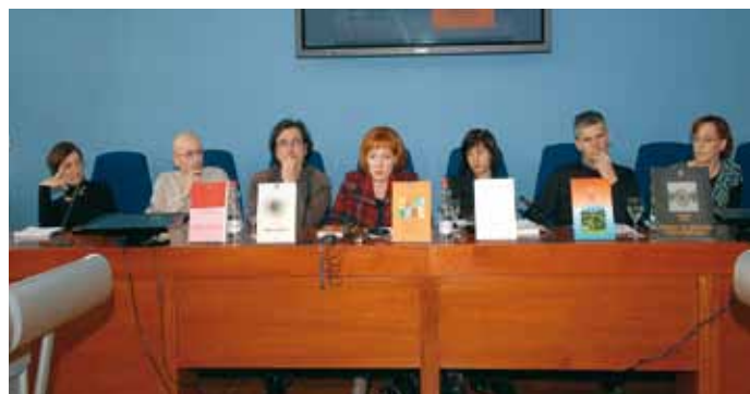
► Avtorji/avtorice ...

revija za umetnost in humanistiko (II/2)