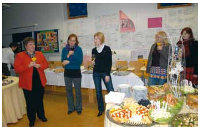
► ... nato pa privezali, da nam ne uide.