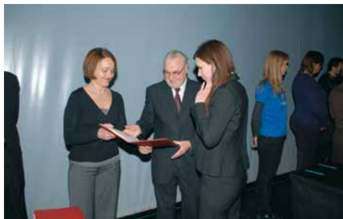
► Takole, vidite, tej mapi se reče diploma ...