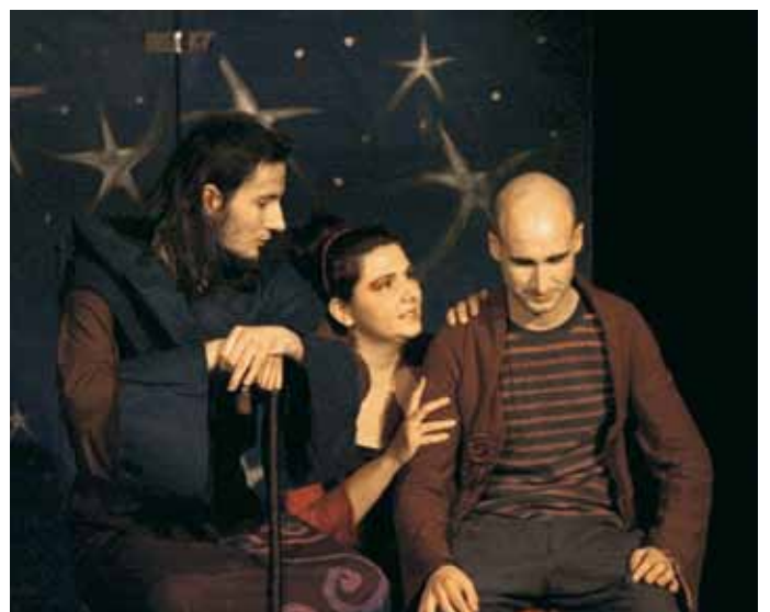
► Pet, deset, petnajst... Čim dlje, tem bolje.