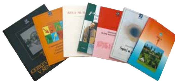
► ... in dela.